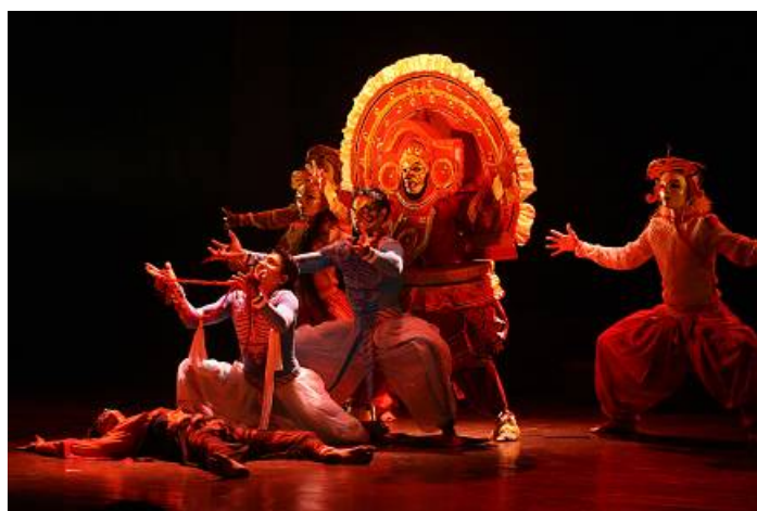
Sadhya - Contemporary Dance Company